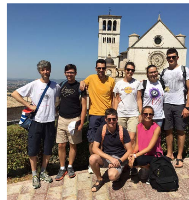
Ad Assisi con i giovani