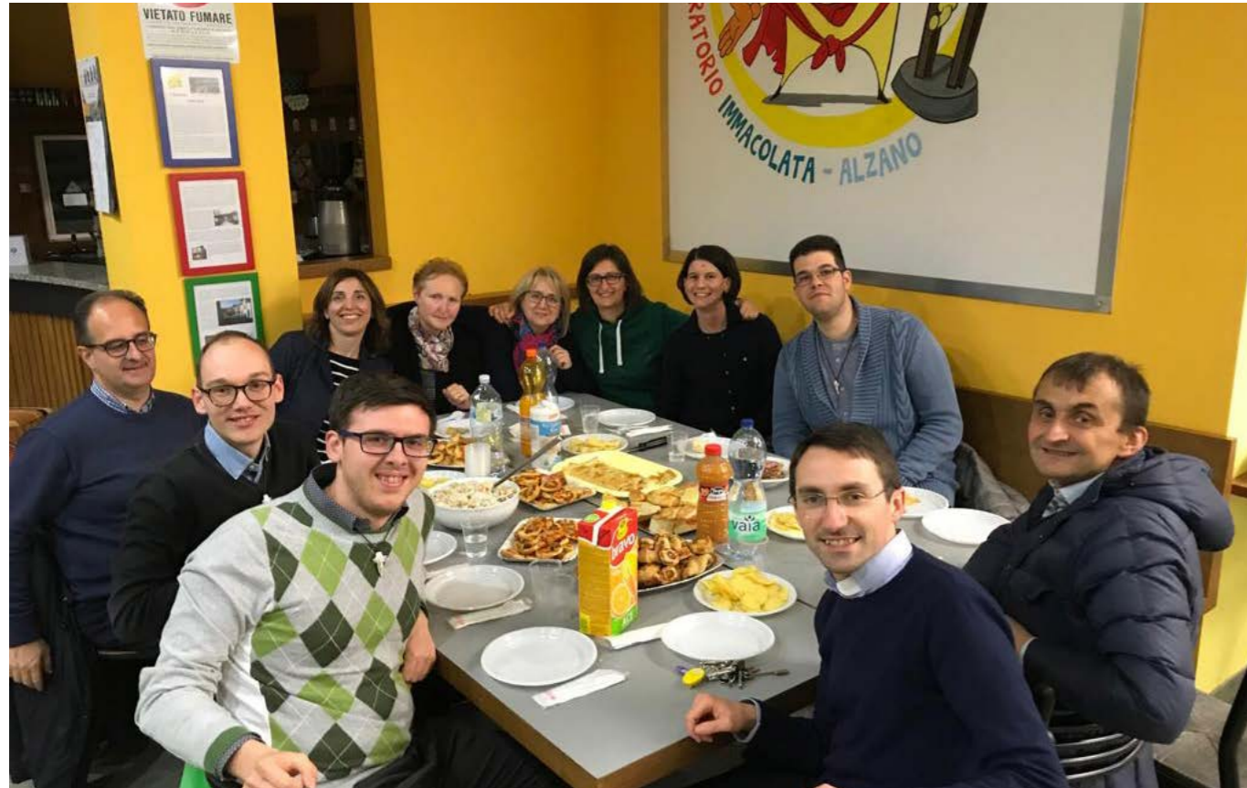
Con gli educatori dell'Oratorio di Alzano