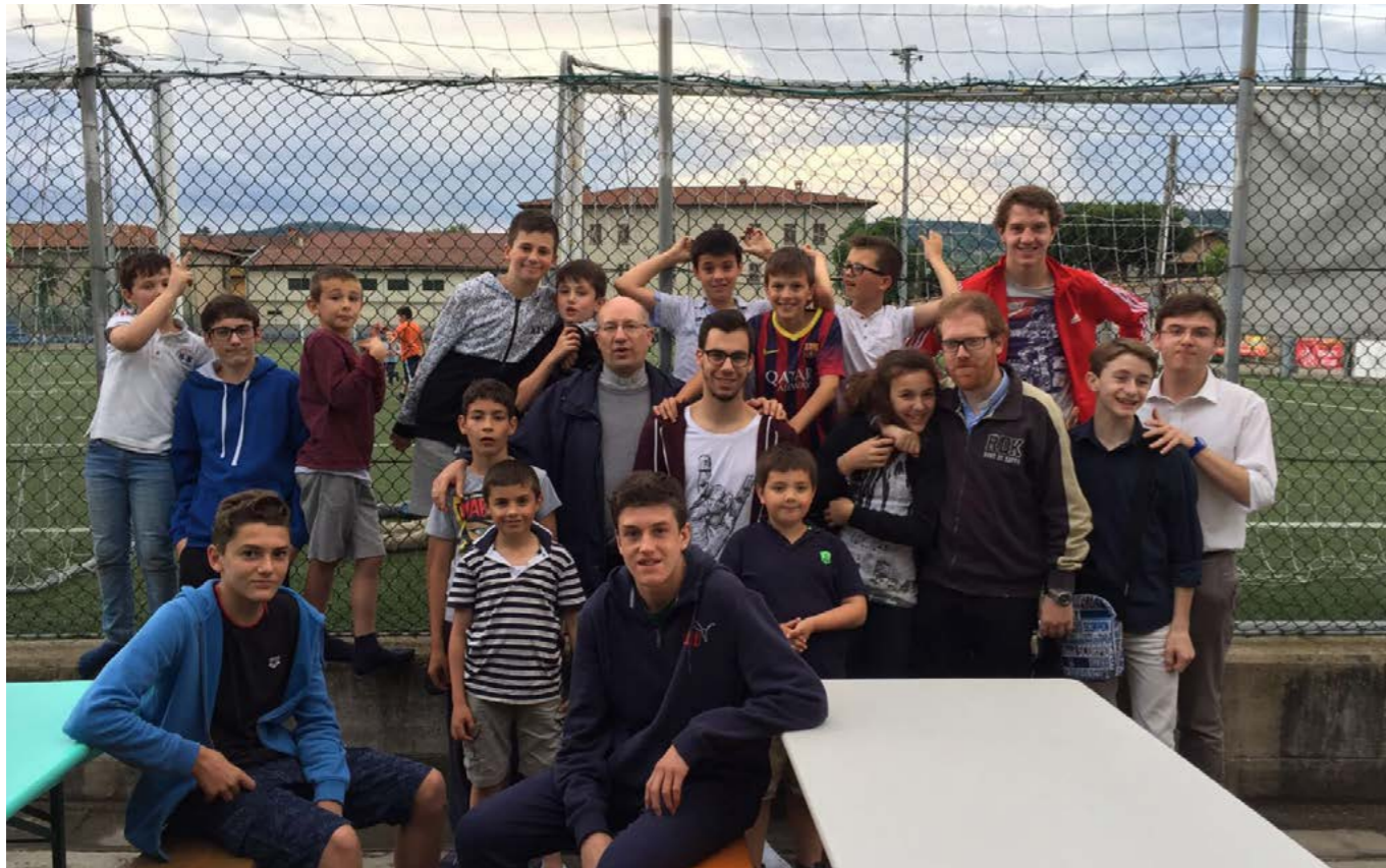
Con i cheirichetti in oratorio