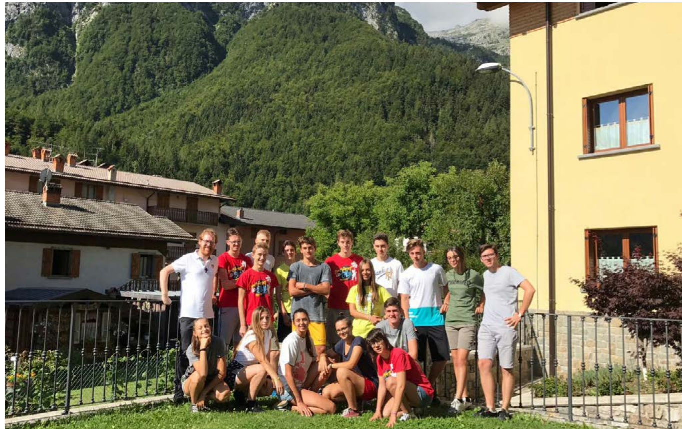
Con gli animatori del Campo Estivo