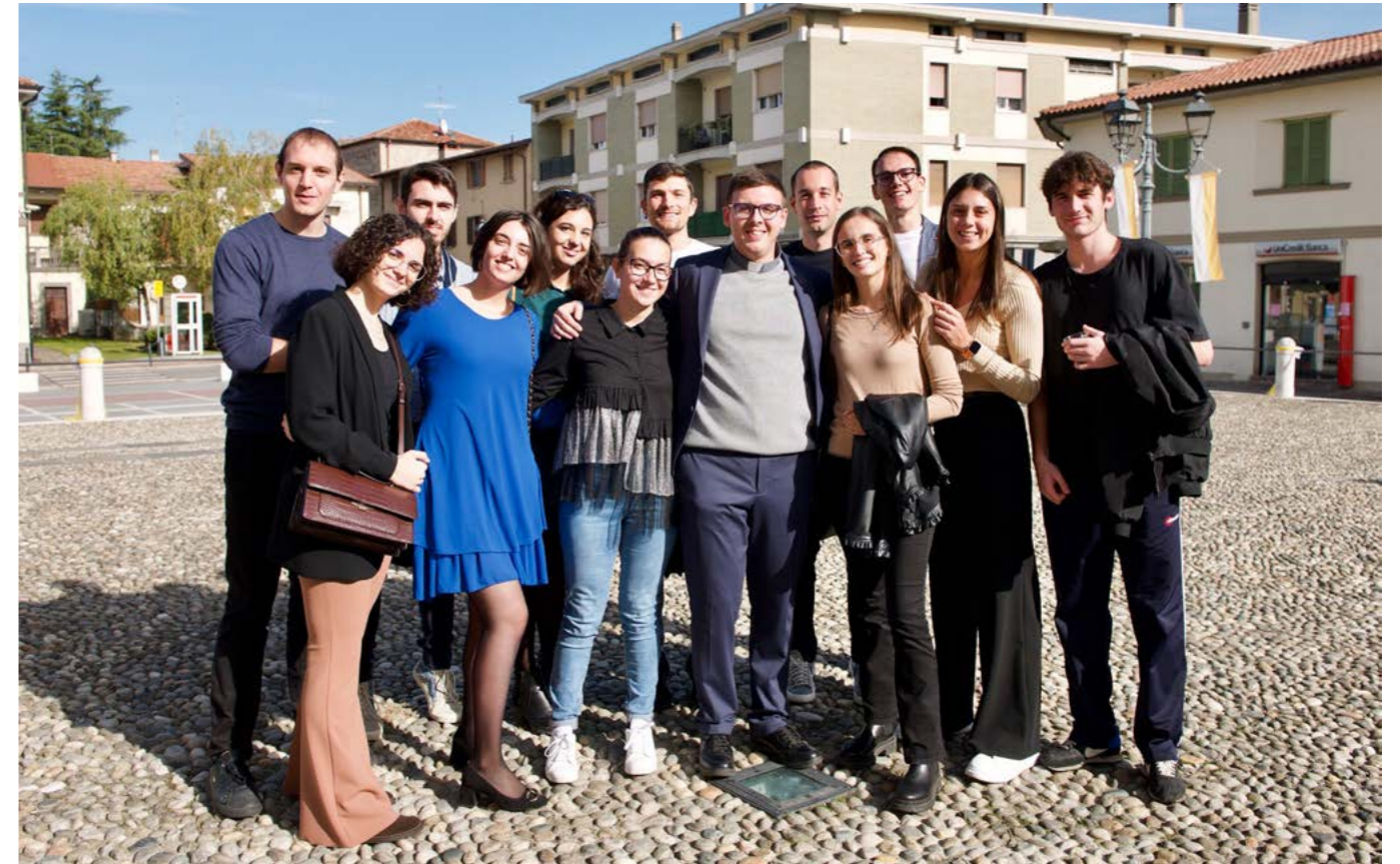
Con giovani dopo ordinazione diaconale