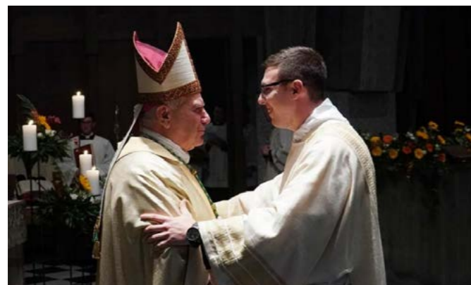
Abbraccio col Vescovo dopo l'ordinazione diaconale

Eppure, in queste tre parole, Giovanni racchiude il significato stesso della vita di Cristo, che muore consegnando il suo Spirito, cioè lo Spirito Santo. Siamo abituati a ricondurre alla Pentecoste l'effusione dello Spirito, ma l'evangelista ricolloca sulla croce il momento in cui Gesù dona tutto