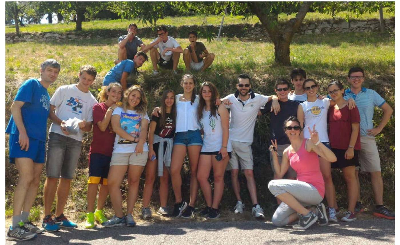
Con gli adolescenti a Verona