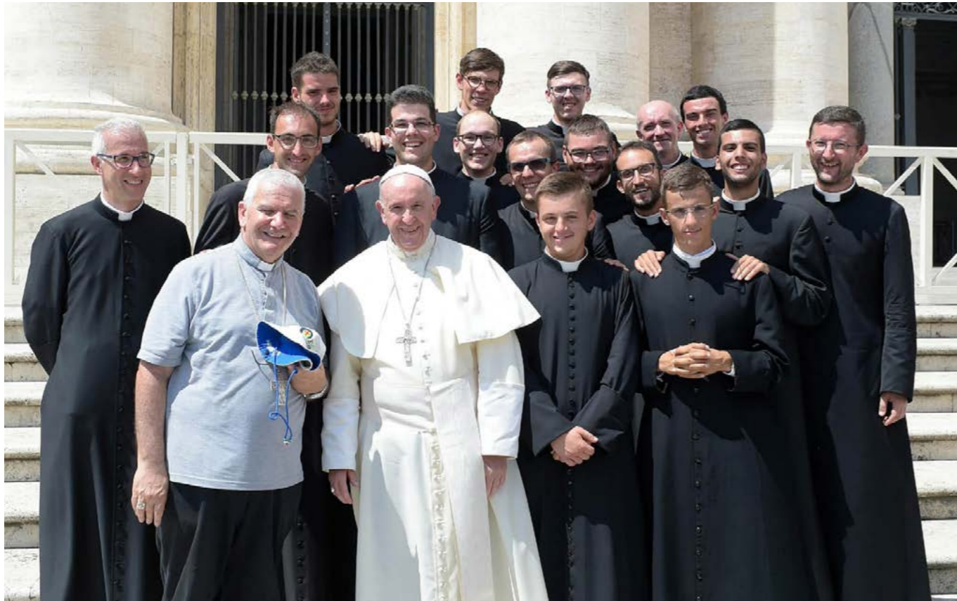
Con i compagni dal Papa