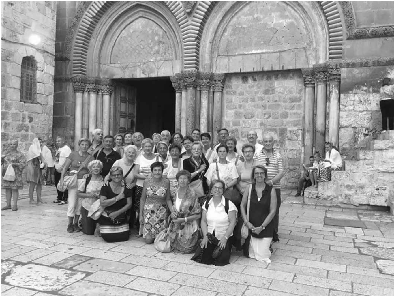
GERUSALEMME - Davanti al "Santo Sepolcro"

priamo il S. Crocifisso". Abbiamo voluto con questo slogan riconoscere che non abbiamo mai raggiunto una volta per tutte le immense profondità del mistero d'amore del Crocifisso. Quindi abbiamo bisogno di contemplarlo e riscoprirlo, continuamente attratti da Lui.