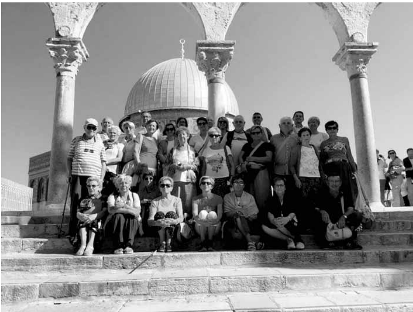
GERUSALEMME - Alla spianata delle moschee