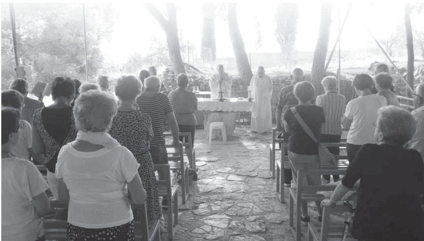
BETLEMME - S. Messa al “Campo dei pastori”

Giovedì 23 agosto un gruppo di parrocchiani ha intrapreso quello che è il pellegrinaggio per eccellenza: il pellegrinaggio in “ Terra Santa ”. Non è stata una gita o una vacanza, è stata la conclusione di un percorso che la parrocchia ha iniziato qualche anno fa.