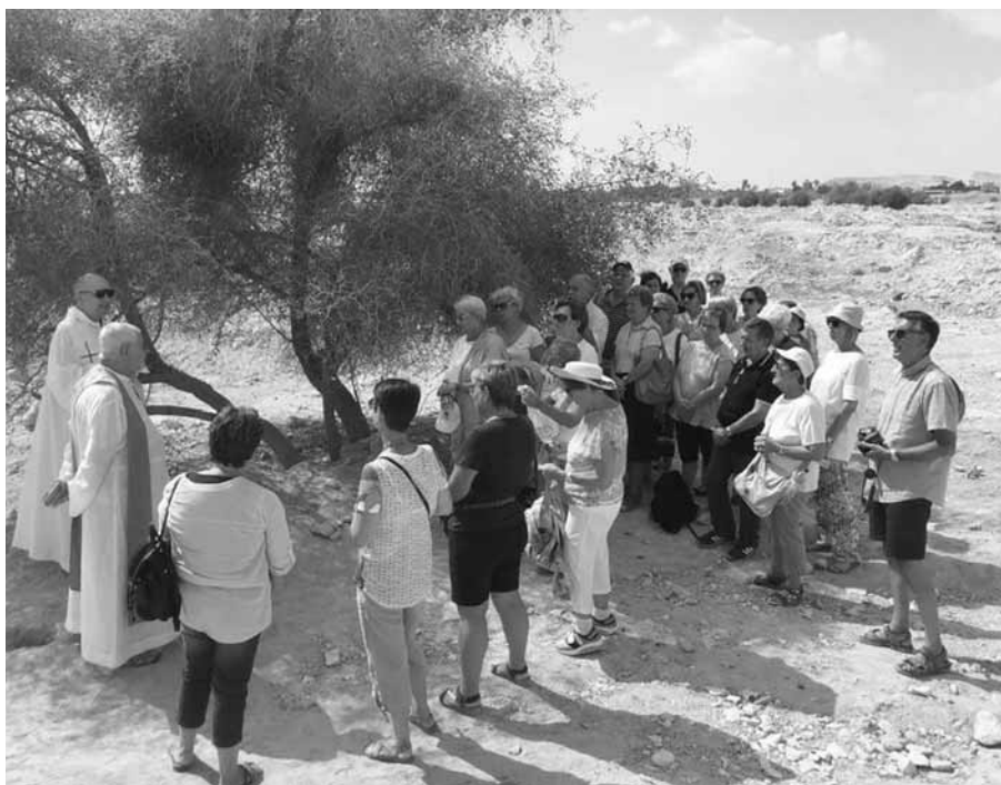
DESERTO - S. Messa prima di arrivare a Gerico

In fine la quarta e conclusiva tappa di questo itinerario IL PELLEGRINAGGIO nei luoghi dove il Figlio di Dio si è incarnato, è stato Crocifisso, è morto sulla Croce ed è risorto per la nostra salvezza. Un pellegrinaggio che ha avuto come tema e filo conduttore: "Alle sorgenti dell'Amore Crocifisso" . L'intento è stato proprio quello di intraprendere un cammino di fede e raggiungere quella meta, quel luogo storico, dove concretamente il Figlio di Dio è sta-