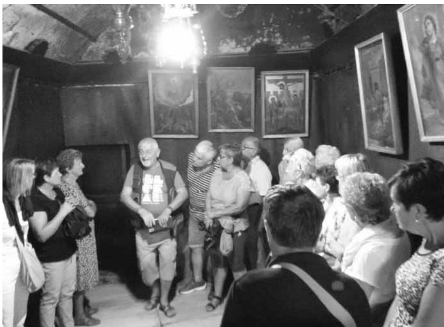
BETLEMME - Preghiera alla “Grotta della Natività”

La seconda tappa ha riguardato tutto il cammino di preparazione e lo svolgersi delle grandi feste per l' 80° dell'INCORONAZIONE dal 9 al 18 settembre 2017. Sappiamo quanto è stato importante per la nostra comunità questo evento di fede e di amore al Crocifisso per il quale dobbiamo sempre ringraziare il Signore. Terza tappa, altrettanto significativa per la parrocchia, sono state LE MISSIONI PARROCCHIALI dal 14 al 29 aprile 2018. Di proposito abbiamo scelto come tema: “ Risco-