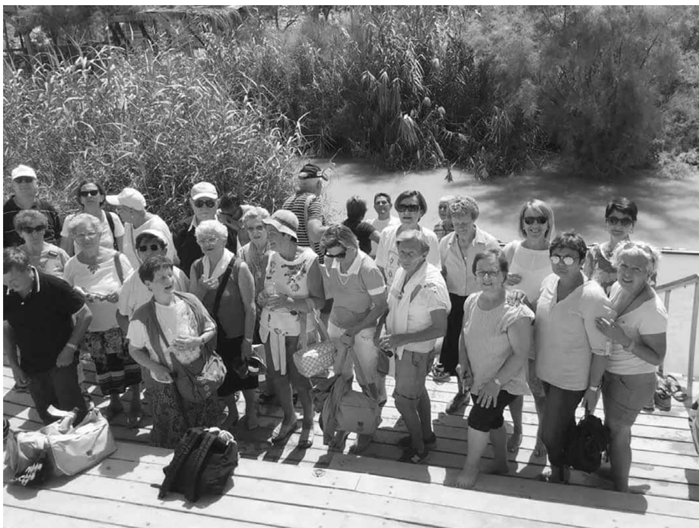
FIUME GIORDANO - Rinnovo delle Promesse Battesimali