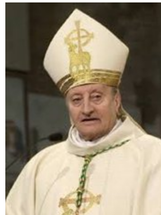
Mons. Giuseppe Merisi Vescovo Emerito di Lodi

S. MESSE: 7:30 - 9:30 - 11:00 - 18:30 Vespri e Processione al cimitero ore 15.30