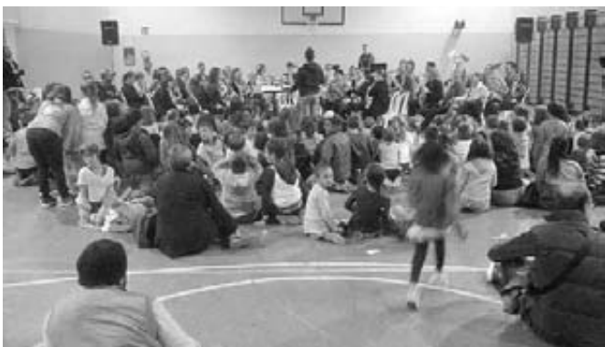
Presentazione scuola di musica alle scuole primarie