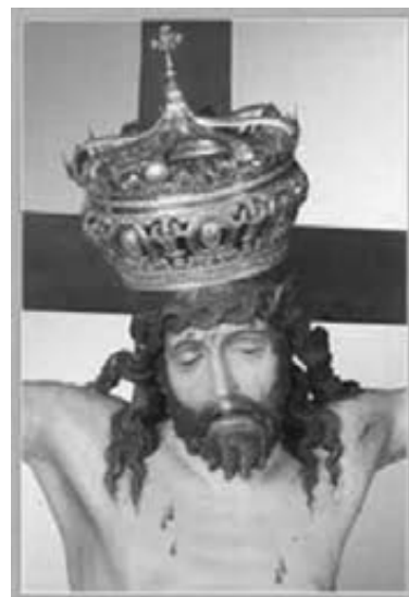
Crocifisso di Telgate

Voglio ricordare che il nostro è il Vicariato Locale di Calepio - Telgate (n° 11) e comprende le parrocchie di Bolgare, Calcinate, Calepio, Chiuduno, Cividino, Grumello, Tagliuno, Telgate.