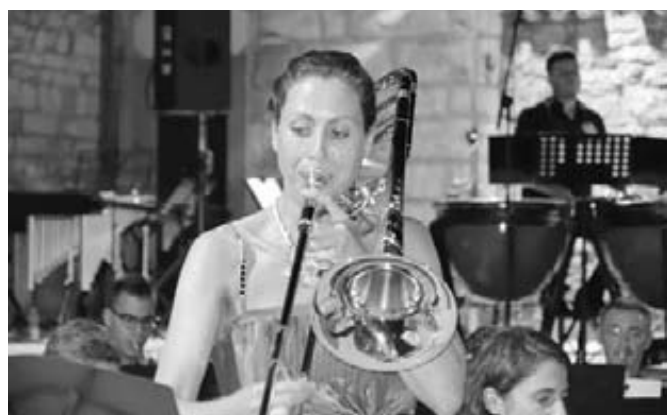
Uno dei tromboni solisti

Nel mese di settembre abbiamo organizzato in collaborazione con il centro anziani il nostro WEEK-END IN FESTA. Nei giorni 4/5/6 settembre si sono svolte 3 serate allietate da musica dal vivo, Karaoke canti popolari e giochi, il tutto accompagnato da una semplice e buona cucina.