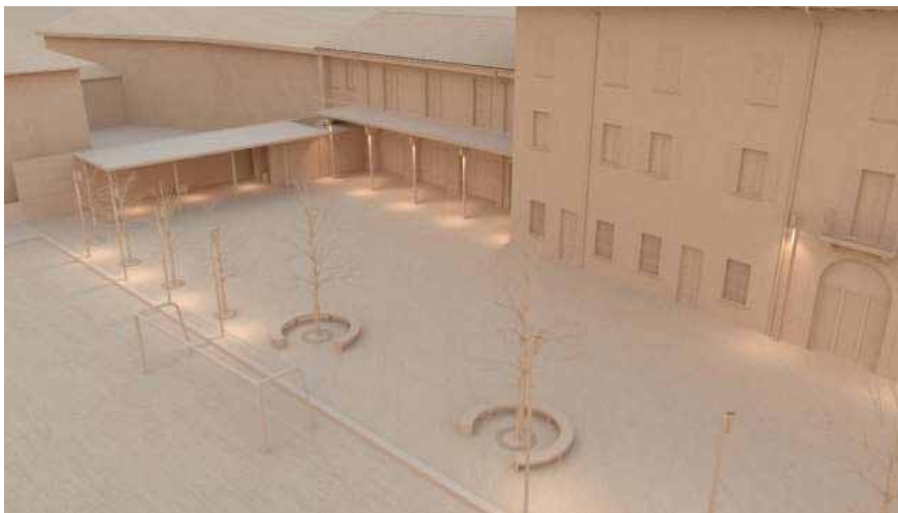
Vista di studio volumetrico per la riqualificazione del cortile dell'Oratorio.

La parte di progetto di rifacimento del cortile, dei locali polivalenti al piano terra e del nuovo vano scale-ascensore sarà già dettagliata per procedere il prima possibile alle successive fasi progettuali e realizzative.